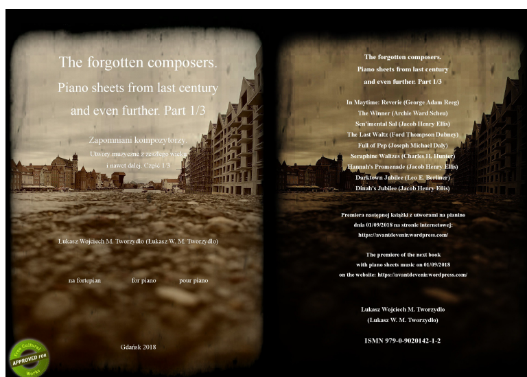
L. W. M. Tworzydło, The forgotten composers. Piano sheets from last century and even further. Part 1/3, Lukasz Wojciech M. Tworzydło, Gdańsk 2018. https://avantdevenir.wordpress.com/books/